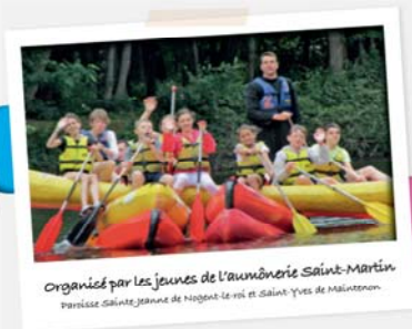
Organisé par les jeunes de l'aumônerie Saint-Martin Paroisse Sainte Jeanne de Nogent-le-Roi et Saint-Yves de Maintenon