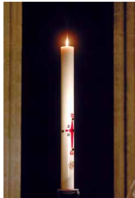
A PINOGES / CTRIC

Au baptême, le cierge remis au parrain est allumé au cierge pascal, symboli-