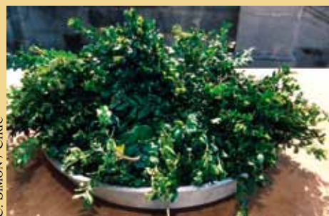
C. SIMON / CIRC