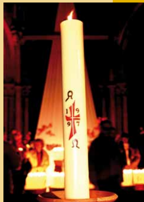
C. MERCIER / CIRC